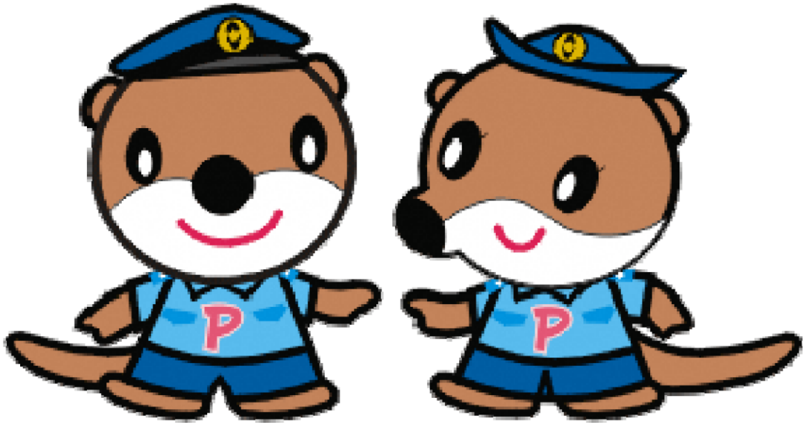
かわうそ ポリンくん

このハンドブックは、県内に居住されている外国人の方が、安全で平穏な生活をしていただくために作成しました。