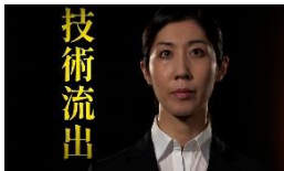
【リスク&ケーススタディ編】