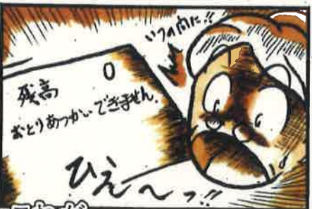
これが 還付金サギ！