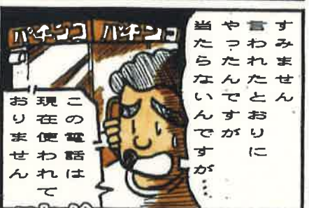
これが ギャンブル必勝法サギ！