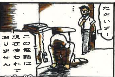
これが 金融商品等サギ！