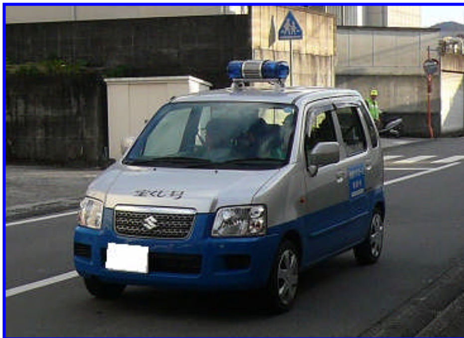
【青色防犯パトロール車両によるパトロールの様様】

青色防犯パトロールは、地域住民に安心感を与え、防犯意識の向上に繋がるとともに、これから犯罪を行おうとする者に対する抑止効果も高いと考えられています。