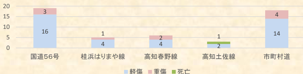
法定・指定速度以上の速度の速度を伴う交通事故発生状況 (発生数の多い路線を抜粋)